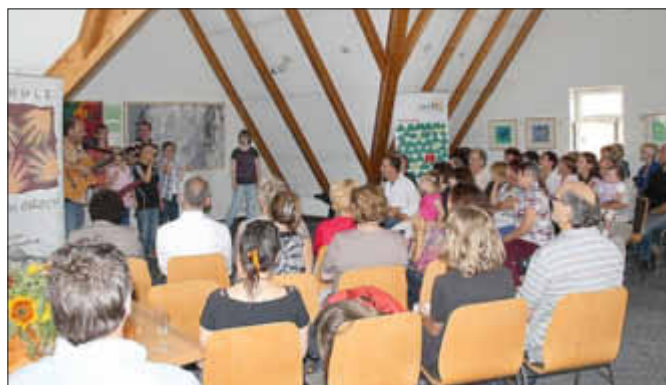
Musikbeitrag des Kinderliedermachers Casi Eisenbarth mit Kindern aus dem Publikum

Die Ausstellung ist noch bis Ende Oktober während der Öffnungszeiten des „Schlösschens“ in Losheim am See, Saarbrücker Straße 13, zu sehen.