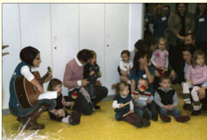
Musikalischer Empfang durch die KiTa-Kinder

Beim anschließenden Rundgang durch das Gebäude zeigten sich die Gäste begeistert und waren ebenfalls voll des Lobes ob der Raumaufteilung, Einrichtung und Ausstattung der neuen KiTa „Sonnengarten“.