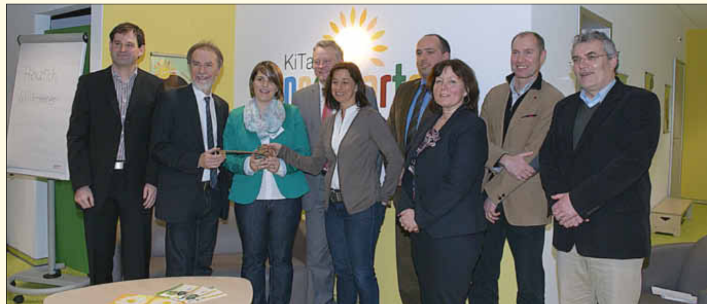
Offizielle Schlüsselübergabe im Kreise der Ehrengäste