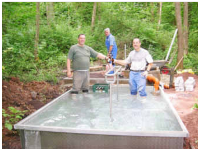
Wassertretanlage mit Quellwasser

Ich bedanke mich schon jetzt für die uneigennützig Unterstützung vieler Helfer, ohne die die Wassertretanlage nicht zustande gekommen wäre.