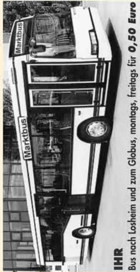
IHR Bus nach Losheim und zum Globus, montags, freitags für 0,50 Euro

Ohne folgende Spender(innen) wäre der erweiterte Service der Gemeinde Losheim am See, der Fa. Huth Reisen und der Saar-Pfalz-Bus nicht möglich gewesen: