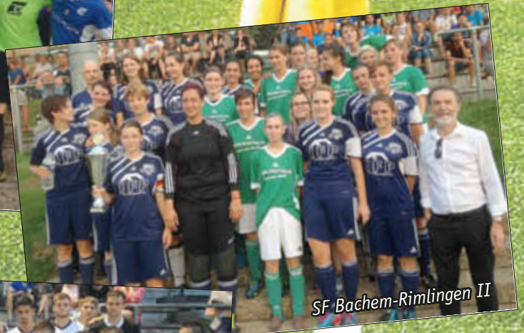
SF Bachem-Rimlingen II