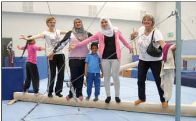
Ehrenamtliche und Flüchtlinge in Aktion

Über 100 Flüchtlinge aus dem Landkreis Merzig-Wadern nahmen gemeinsam mit ihren ehrenamtlichen Betreuern und Mitarbeitern des Landkreises am Freitag, den 8. Mai, an der „Langen Nacht des Sports“ an der Hermann-Neuberger-Sportschule in Saarbrücken teil. Die Kinder, Jugendlichen und Erwachsenen, die zurzeit in den Städten und Gemeinden im Landkreis untergebracht sind, konnten von 19 bis 24 Uhr an der Sportschule über 50 Sportangebote aus verschiedenen Bereichen ausprobieren und sich ein abwechslungsreiches Showprogramm anschauen. Der Landkreis Merzig-Wadern sorgte gemeinsam mit dem Landessportverband für das Saarland (LSVS) dafür, dass die Flüchtlinge an der Veranstaltung teilnehmen konnten und übernahm Organisation und Transport. Die Flüchtlinge nahmen das Angebot als willkommene Abwechslung an und hatten vor Ort viel Spaß beim Testen neuer Sportarten.