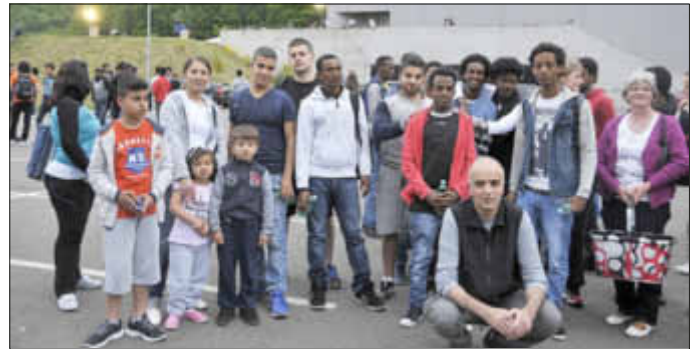
Gruppe aus Losheim vor der Turnhalle

insbesondere für die noch nicht anerkannten Flüchtlinge, denen oft ein sinnvolles Beschäftigungsprogramm fehlt. Zudem bietet Sport eine gute Gelegenheit andere Menschen kennenzulernen und fördert die Integration. So war man sich untereinander auch einig, dass man an einer solchen Veranstaltung gerne nochmals teilnimmt.