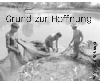
Grund zur Hoffnung

Ein Entwicklungsprojekt von „Brot für die Welt“ hilft den aus den Urwäldern vertriebenen Garo in Bangladesch, sich von dem zu ernähren, was die Erde ihnen schenkt. Alternative Einkommensquellen wie Pilz- und Fischzucht tragen dazu bei, den Hunger zu bekämpfen und die tägliche Ernährung zu sichern.