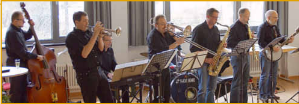
Sir Henry's Jazz Band

„Scheitern ist nicht das Gegenteil von Erfolg, sondern es ist ein Teil davon. Auch nach Rückschlägen aufstehen und weiter machen.“