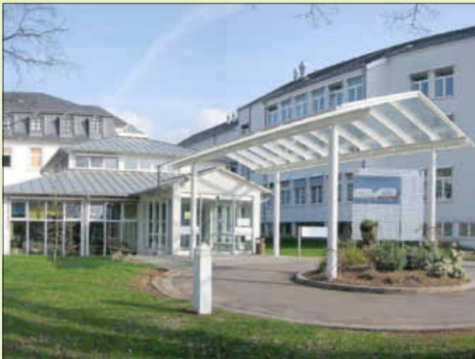
Krankenhaus Losheim bleibt als Akut Krankenhaus erhalten

Wir hoffen, dass ein neues Verbundkrankenhaus Losheim, Wadern, Lebach mit dem rheinland-pfälzischen Standort Hermeskeil so gut funktionieren wird, wie das jetzige Verbundkrankenhaus Losheim-Wadern.