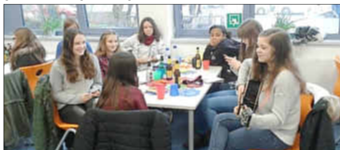
Die Austauschschüler bei bester Stimmung in der Losheimer Schulkantine

Schüler aus Volmerange waren für drei Tage zu Besuch an der PDG Seit 1996 gibt es Kontakte zwischen der Peter-Dewes-Gemeinschaftsschule und dem Collège von Volmerange les Mines. Der Ort liegt etwa 60 Kilometer von Losheim entfernt zwischen Metz und Luxemburg, direkt an der Grenze zum Großherzogtum. 2001 wurde die Partnerschaft zwischen den beiden Schulen offiziell besiegelt und es haben sich viele Freundschaften zwischen Schülern und Lehrern entwickelt. Über drei Tage waren wieder 17 Schülerinnen und Schüler zu Gast an der Peter-Dewes-Gemeinschaftsschule. Zuvor hatten sie in der Klassenstufe 5 erste Briefkontakte geknüpft. Ein Jahr später besuchten sie sich gegenseitig für einen Tag. Jetzt standen drei gemeinsame Tage auf dem Programm. In der Schulkantine wurde gemeinsam gefrühstückt, geredet, gelacht und musiziert.