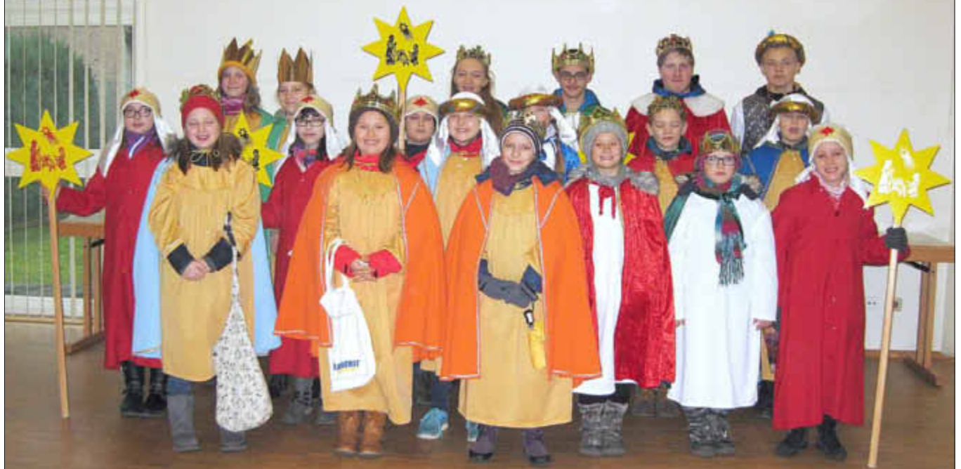
Sternsinger in der Gemeinde Losheim am See