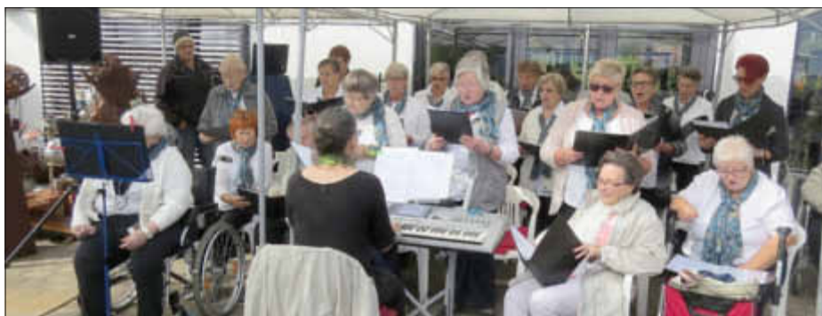
Seniorenchor des Hauses Weiherberg

Seniorinnen und Senioren ausgiebig dem Austausch von Neuigkeiten widmen und Erinnerungen auffrischen. Großen Zuspruch gab es auch bei den angebotenen Führungen durch den Park. An dieser Stelle nochmals ein herzliches Dankeschön an alle, die zur Durchführung und Gestaltung des Tages beigetragen haben: der Sparkasse Merzig-Wadern für die finanzielle Unterstützung; der Freiwilli-