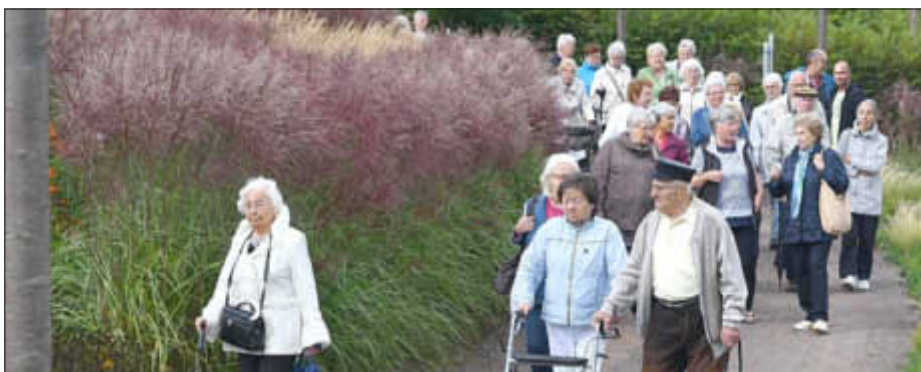
Führung der Gäste durch den SeeGarten