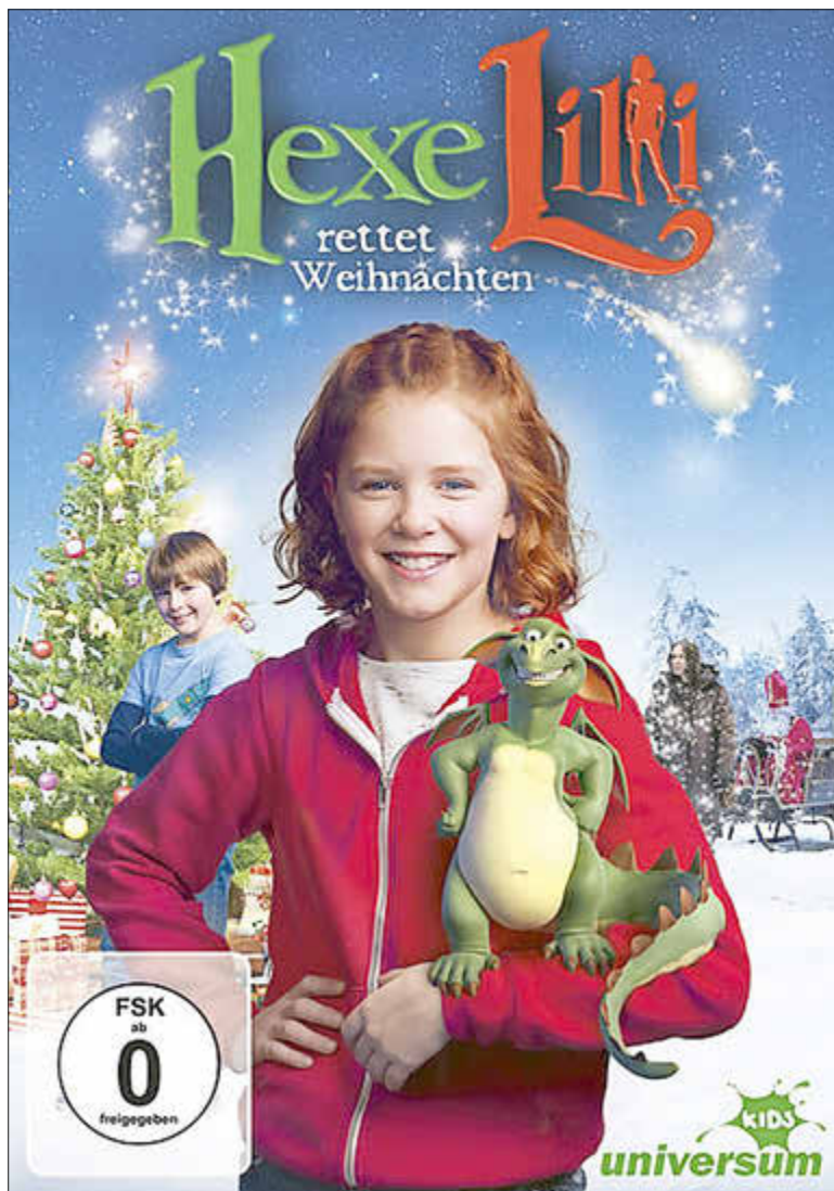
Hexe Lilli rettet Weihnachten